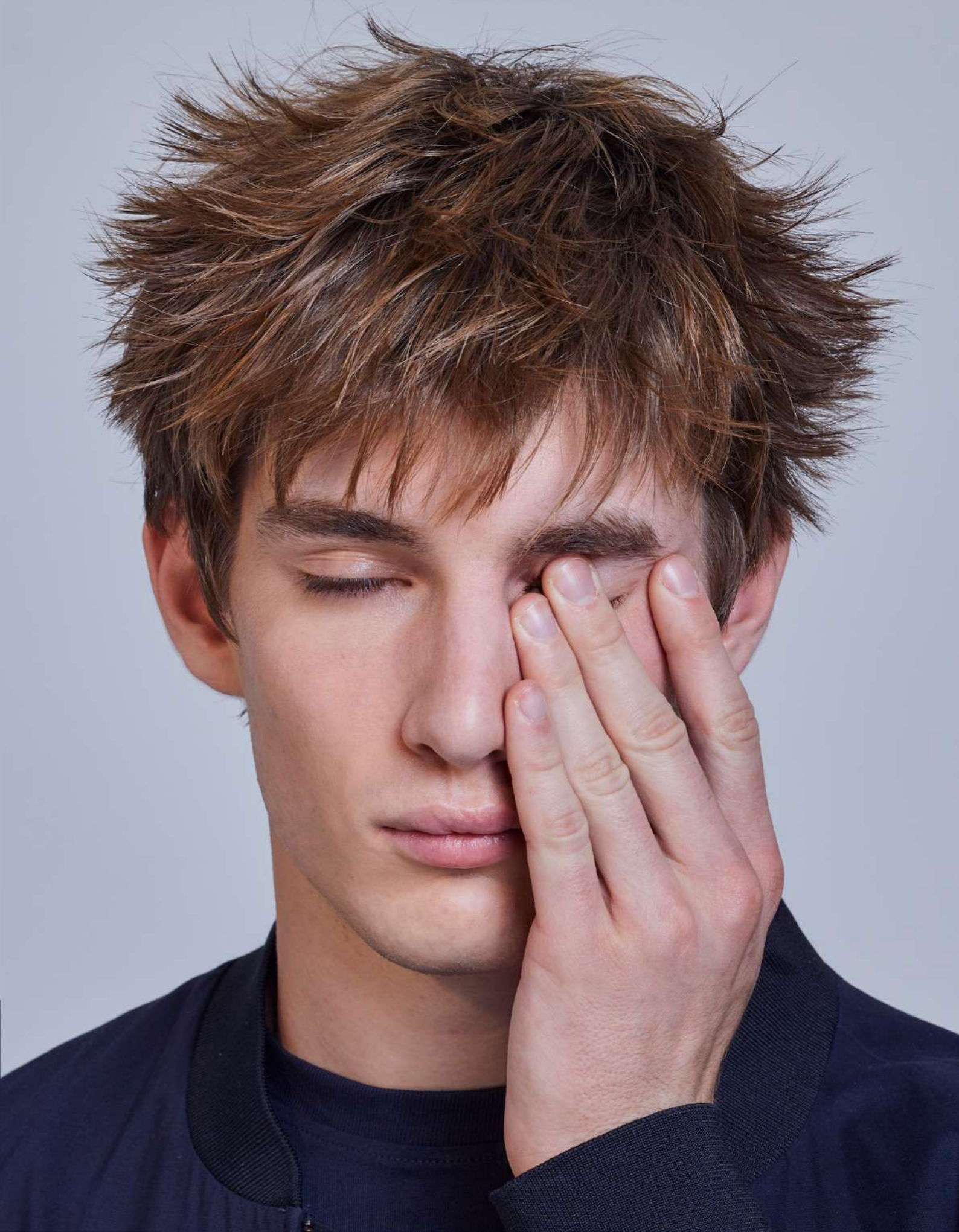
Joel Camiseta: Polo Club Bomber: Mango