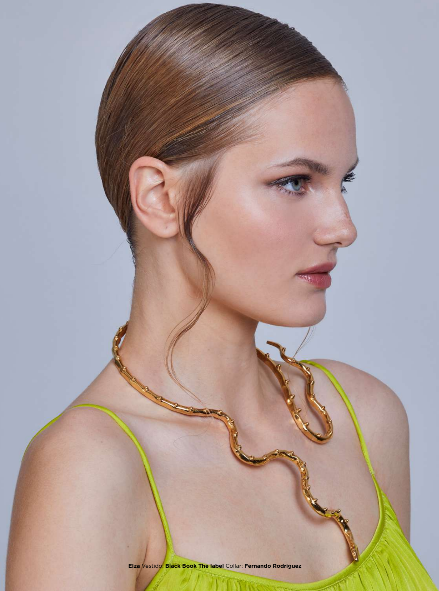
Elza Vestido: Black Book The label Collar: Fernando Rodriguez