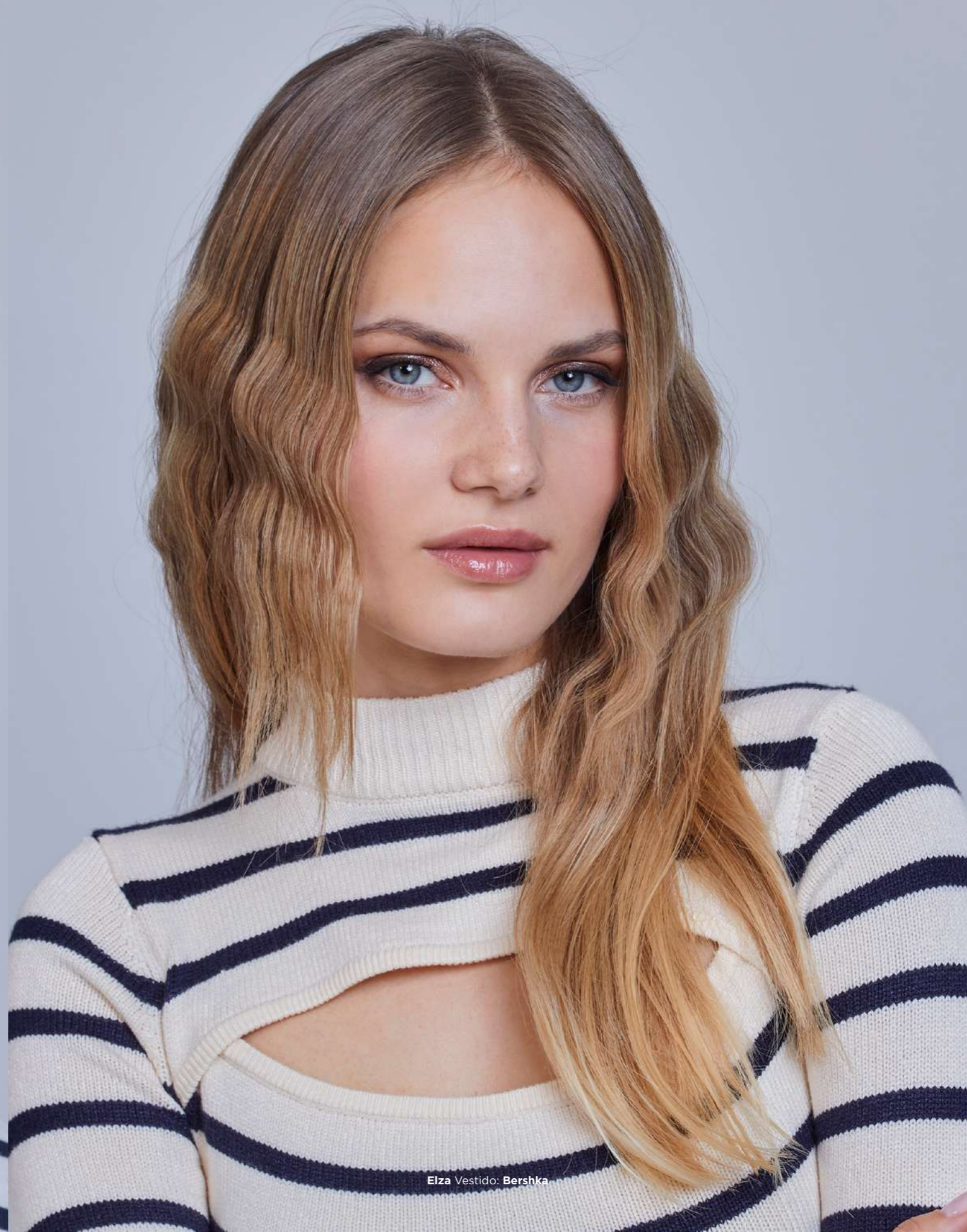
Elza Vestido: Bershka