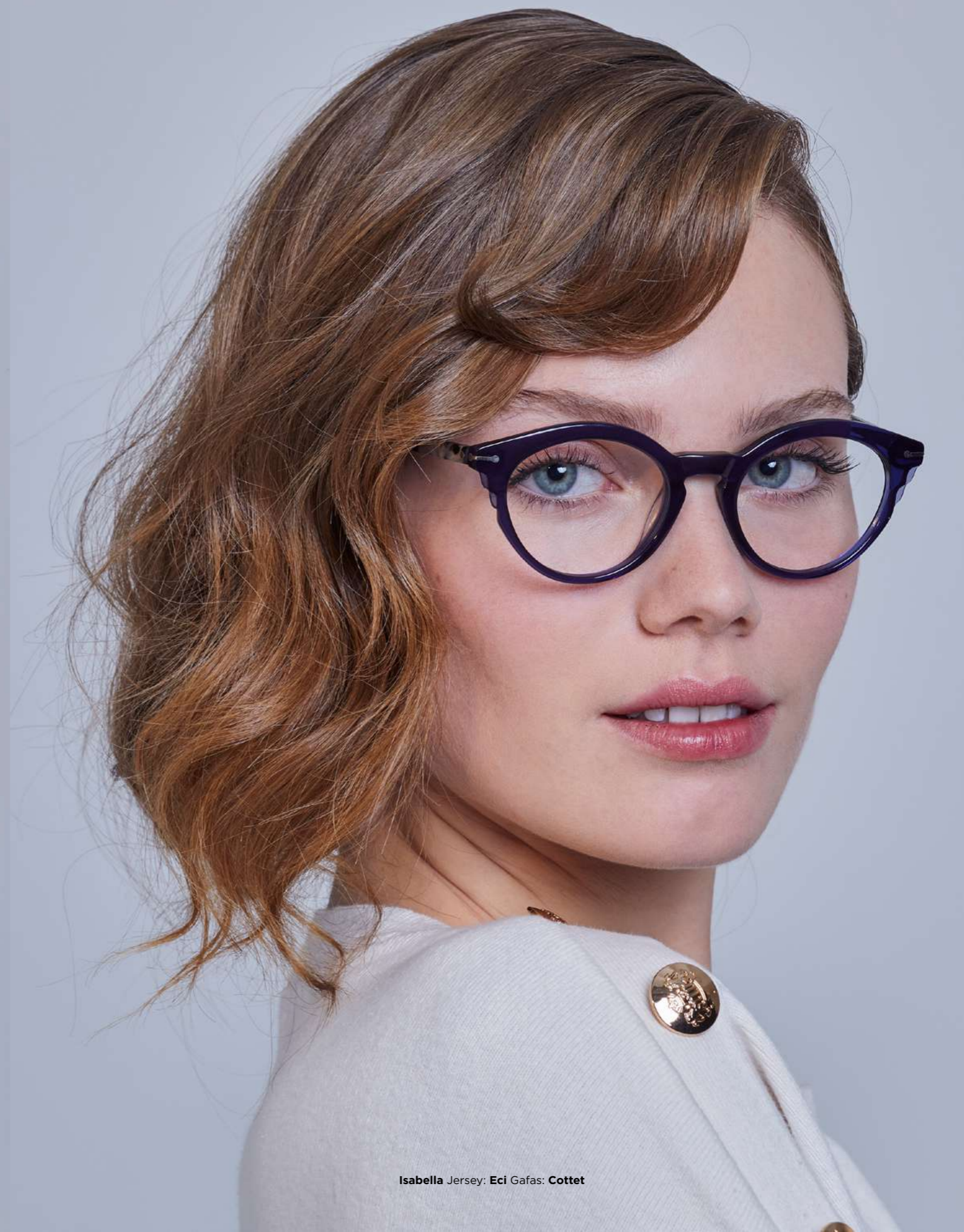
Isabella Jersey: Eci Gafas: Cottet